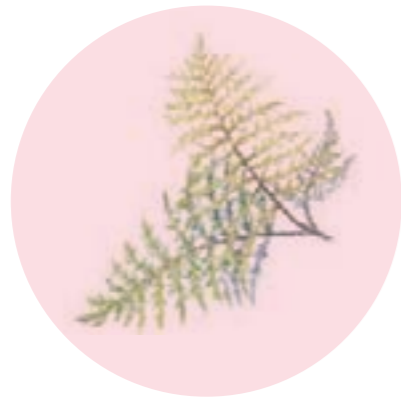
Nom científic: Hylocomium splendens Estrat: molsa