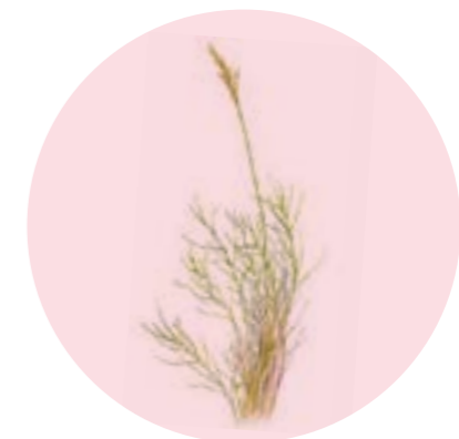
Nom comú: LLISTÓ o FENÀS Nom científic: Brachypodium retusum Estrat: herba