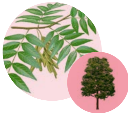
Nom comú: FREIXE DE FULLA GRAN Nom científic: Fraxinus excelsior Estrat: arbre secundari