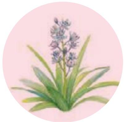
Nom comú: JOLIU Nom científic: Scilla lilio-hyacinthus Estrat: herba