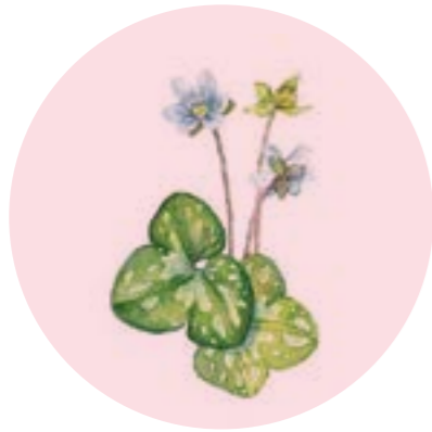
Nom comú: HERBA FETGERA Nom científic: Anemone hepatica Estrat: herba