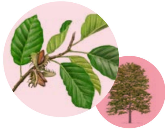
Nom comú: FAIG Nom científic: Fagus sylvatica Estrat: arbre dominant de les fagedes