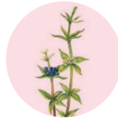
Nom comú: ROGETA Nom científic: Rubia peregrina Estrat: herba de pinedes mediterrànies