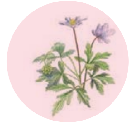
Nom comú: BUIXOL Nom científic: Anemone nemorosa Estrat: herba