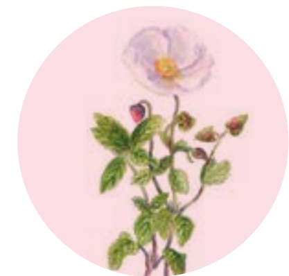
Nom comú: ESTEPA BORRERA Nom científic: Cistus salviifolius Estrat: arbust