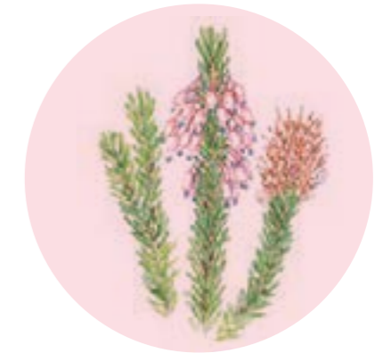
Nom comú: BRUC D'HIVERN Nom científic: Erica multiflora Estrat: arbust