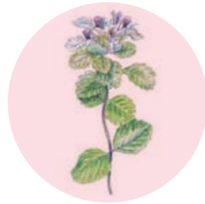
Nom comú: ANGELINS Nom científic: Teucrium pyrenaicum Estrat: herba