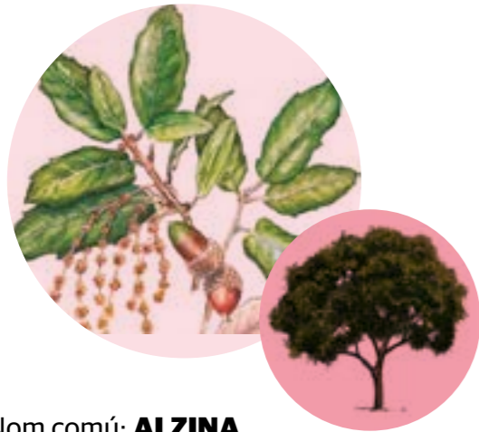
Nom comú: ALZINA Nom científic: Quercus ilex Estrat: arbre dominant