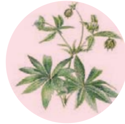
Nom comú: EL-LÈBOR VERD Nom científic: Elleborus viridis Estrat: herba