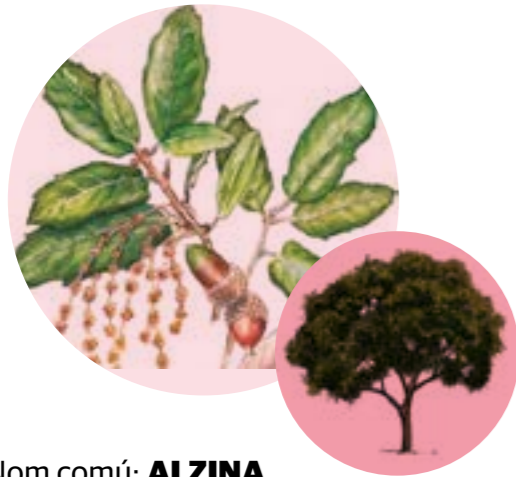
Nom comú: ALZINA Nom científic: Quercus ilex Estrat: arbre dominant