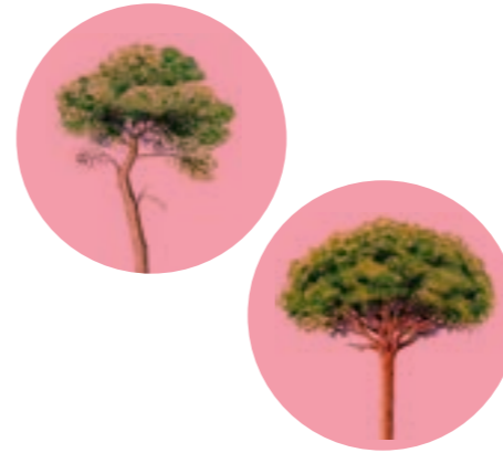
Nom comú: PINS DIVERSOS Nom científic: Pinus spp. Estrat: arbre secundari