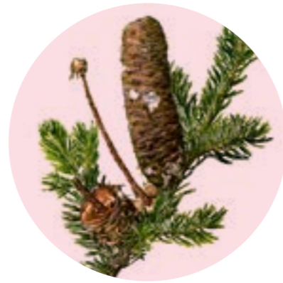
Nom comú: AVET Nom científic: Abies alba Estrat: arbre dominant de les avetoses