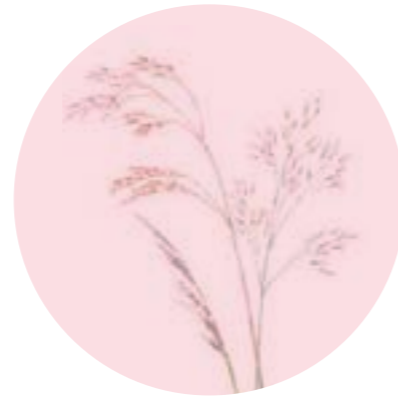
Nom comú: DESCÀMPSIA Nom científic: Deschampsia flexuosa Estrat: herba