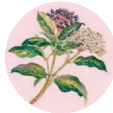
Nom comú: MARFULL Nom científic: Viburnum tinus Estrat: arbust de rouredes submediterrànies