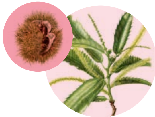
Nom comú: CASTANYER Nom científic: Castanea sativa Estrat: arbre secundari