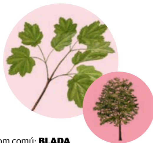
Nom comú: BLADA Nom científic: Acer opalus Estrat: arbre secundari