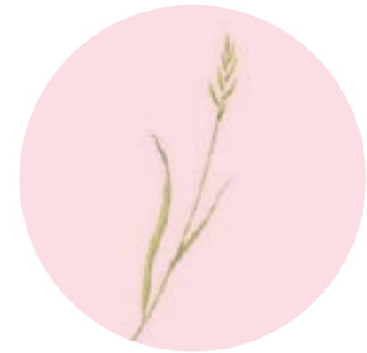
Nom comú: FENÀS DE BOSC Nom científic: Brachypodium sylvaticum Estrat: herba