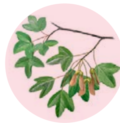
Nom comú: AURÓ NEGRE Nom científic: Acer monspessulanum Estrat: arbre secundari