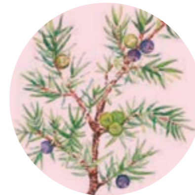
Nom comú: GINEBRÓ Nom científic: Juniperus communis Estrat: arbust