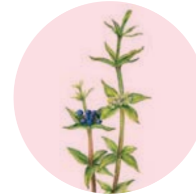
Nom comú: ROGETA Nom científic: Rubia peregrina Estrat: herba de rouredes submediterrànies