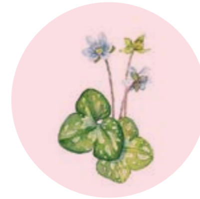
Nom comú: HERBA FETGERA Nom científic: Anemone hepatica Estrat: herba