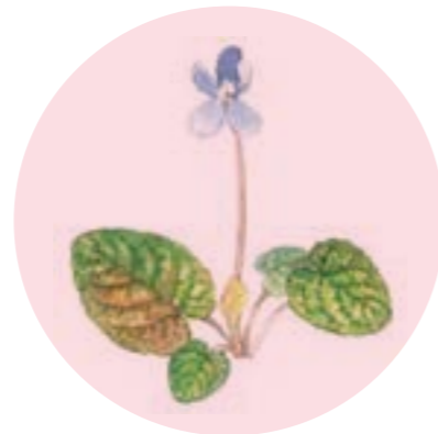
Nom comú: VIOLETA DE BOSC Nom científic: Viola alba Estrat: herba