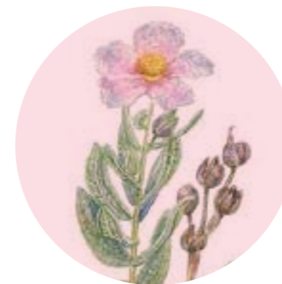
Nom comú: ESTEPA BLANCA Nom científic: Cistus albidus Estrat: arbust