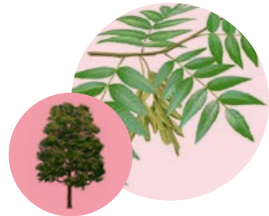
Nom comú: FREIXE DE FULLA GRAN Nom científic: Fraxinus excelsior Estrat: arbre secundari