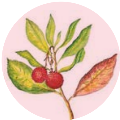
NNom comú: CIRERER D'ARBOÇ Nom científic: Arbutus unedo Estrat: arbust de rouredes submediterrànies