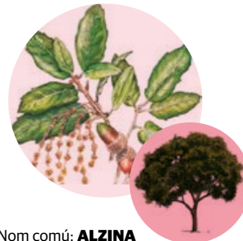
Nom comú: ALZINA Nom científic: Quercus ilex Estrat: arbre secundari