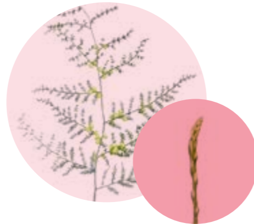
Nom comú: ESPARREGUERA Nom científic: Asparagus acutifolius Estrat: arbust