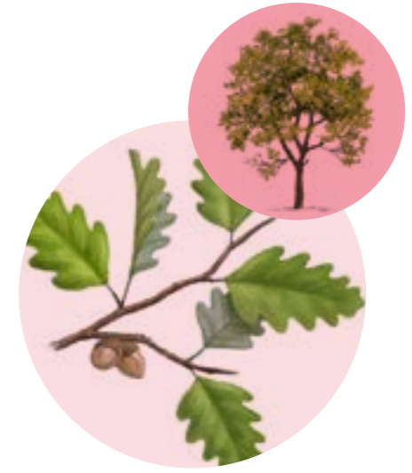
Nom comú: ROURE MARTINENC Nom científic: Quercus pubescens Estrat: arbre secundari