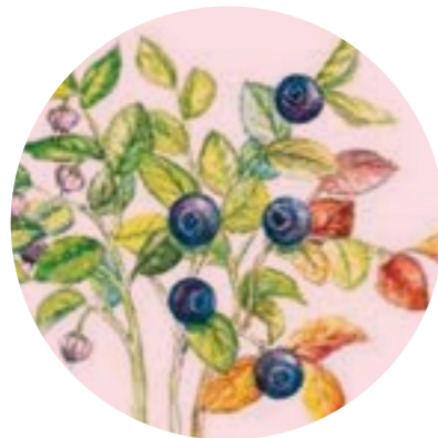
Nom comú: NABIU Nom científic: Vaccinium myrtillus Estrat: arbust