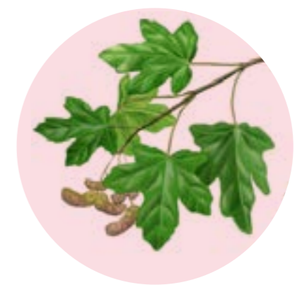
Nom comú: AURÓ BLANC Nom científic: Acer campestre Estrat: arbre secundari