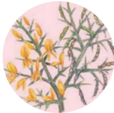
Nom comú: ARGELAGA Nom científic: Genista scorpius Estrat: arbust