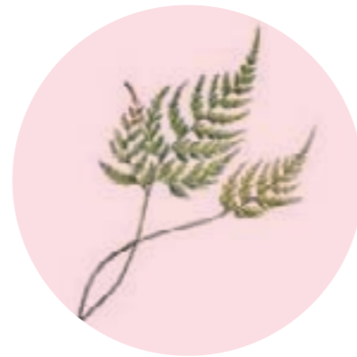
Nom comú: FALZIA NEGRA Nom científic: Asplenium adiantum-nigrum Estrat: falguera de rouredes submediterrànies