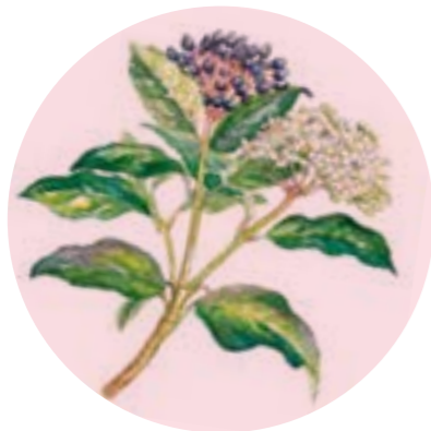
Nom comú: MARFULL Nom científic: Viburnum tinus Estrat: arbust