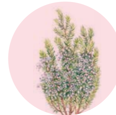
Nom comú: BRUC BOAL Nom científic: Erica arborea Estrat: arbust de pinedes mediterrànies