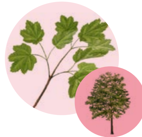
Nom comú: BLADA Nom científic: Acer opalus Estrat: arbre secundari