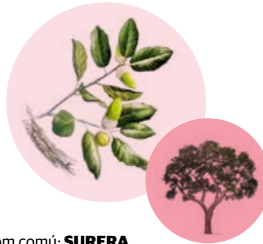
Nom comú: SURERA Nom científic: Quercus suber Estrat: arbre secundari o dominant