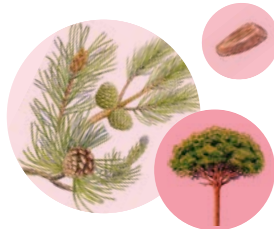
Nom comú: PI PINYER Nom científic: Pinus pinea Estrat: arbre dominant de les pinedes de pi pinyer