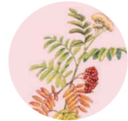
Nom comú: MOIXERA Nom científic: Sorbus spp. Estrat: arbre secundari