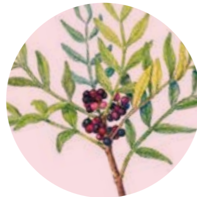
Nom comú: LLENTISCLE Nom científic: Pistacia lentiscus Estrat: arbust de rouredes submediterrànies