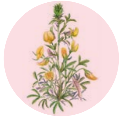
Nom comú: GAVÓ MARÍ Nom científic: Ononis natrix subsp. ramosissima Estrat: herba