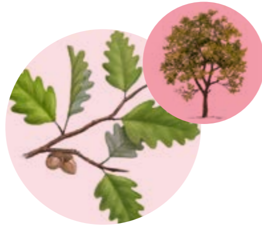
Nom comú: ROURE MARTINENC Nom científic: Quercus pubescens Estrat: arbre secundari