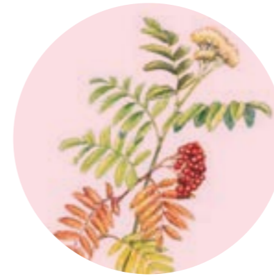
Nom comú: MOIXERA DE GUILLA Nom científic: Sorbus aucuparia Estrat: arbre secundari