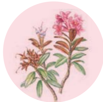
Nom comú: NERET Nom científic: Rhododendron ferrugineum Estrat: arbust