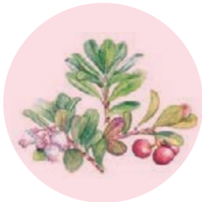
Nom comú: RAÏM D'OSSA (o D'OS), BOIXEROLA Nom científic: Arctostaphylos uva-ursi Estrat: arbust