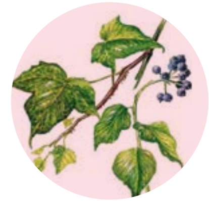
Nom comú: HEURA Nom científic: Hedera helix Estrat: liana