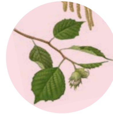
Nom comú: AVELLANER Nom científic: Corylus avellana Estrat: arbust