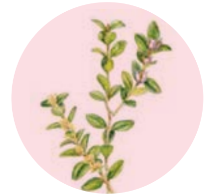
Nom comú: BOIX Nom científic: Buxus sempervirens Estrat: arbust