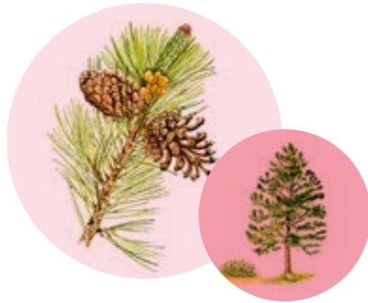
Nom comú: PI NEGRE Nom científic: Pinus uncinata Estrat: arbre dominant de les pinedes de pi negre