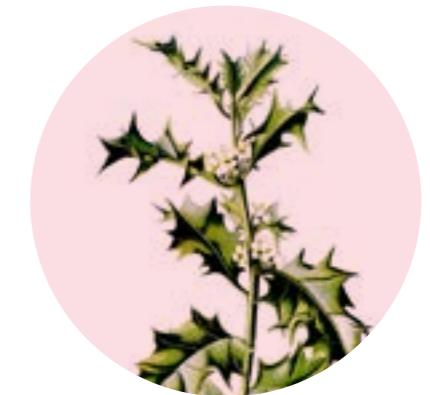
Nom comú: GRÈVOL Nom científic: Ilex aquifolium Estrat: arbre secundari