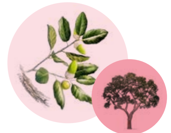
Nom comú: SURERA Nom científic: Quercus suber Estrat: arbre secundari