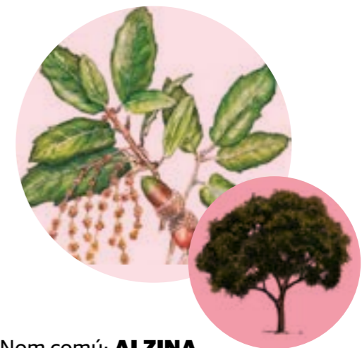
Nom comú: ALZINA Nom científic: Quercus ilex Estrat: arbre secundari