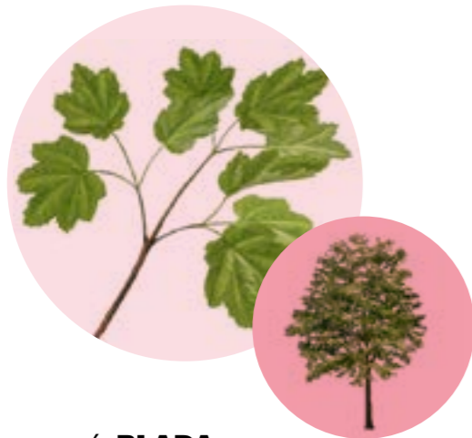
Nom comú: BLADA Nom científic: Acer opalus Estrat: arbre secundari