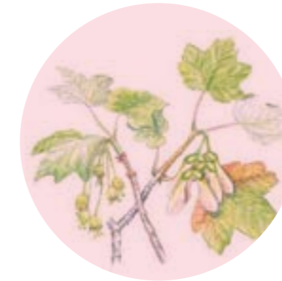
Nom comú: BLADA DE FULLA PETITA Nom científic: Acer opalus subsp. granatense Estrat: arbust