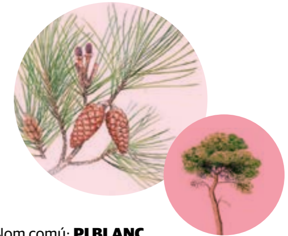
Nom comú: PI BLANC Nom científic: Pinus halepensis Estrat: arbre secundari