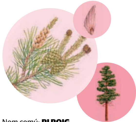
Nom comú: PI ROIG Nom científic: Pinus sylvestris Estrat: arbre dominant