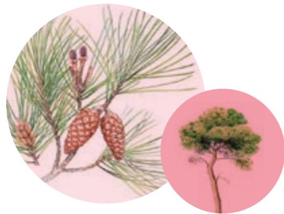
Nom comú: PI BLANC Nom científic: Pinus halepensis Estrat: arbre dominant de les pinedes de pi blanc