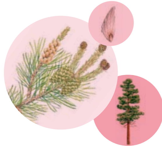
Nom comú: PI ROIG Nom científic: Pinus sylvestris Estrat: arbre secundari