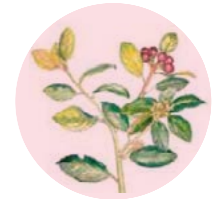
Nom comú: ALADERN Nom científic: Rhamnus alaternus Estrat: arbust de pinedes mediterrànies