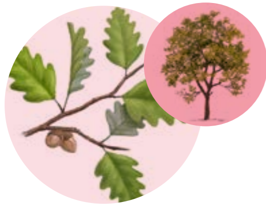
Nom comú: ROURE (diferents espècies i híbrids) Nom científic: Quercus spp. Estrat: arbre dominant de les rouredes