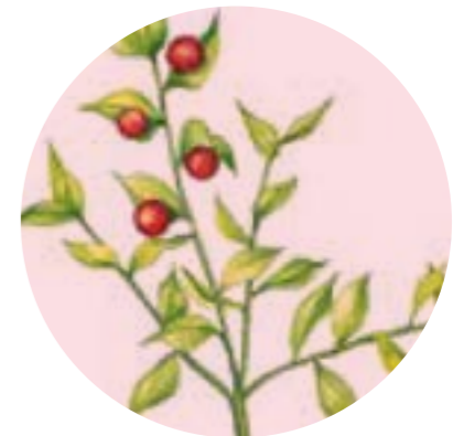
Nom comú: GALZERAN Nom científic: Ruscus aculeatus Estrat: arbust de rouredes submediterrànies