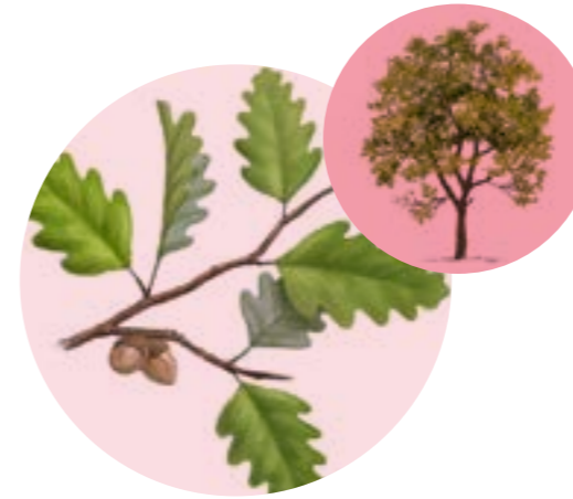
Nom comú: ROURE MARTINENC Nom científic: Quercus pubescens Estrat: arbre secundari