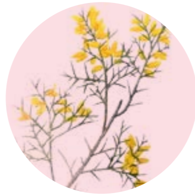
Nom comú: GATOSA Nom científic: Ulex parviflorus Estrat: arbust