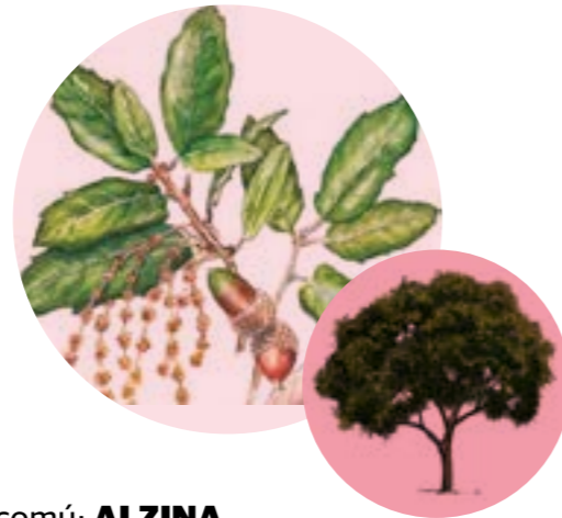
Nom comú: ALZINA Nom científic: Quercus ilex Estrat: arbre secundari d'algunes pinedes mediterrànies