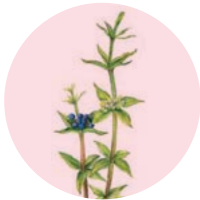
Nom comú: ROGETA Nom científic: Rubia peregrina Estrat: herba de rouredes submediterrànies