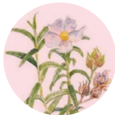
Nom comú: ESTEPA NEGRA Nom científic: Cistus monspeliensis Estrat: arbust