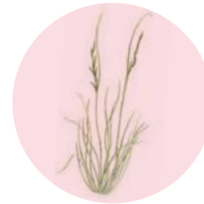
Nom comú: FENÀS DE MARGE Nom científic: Brachypodium phoenicoides Estrat: herba