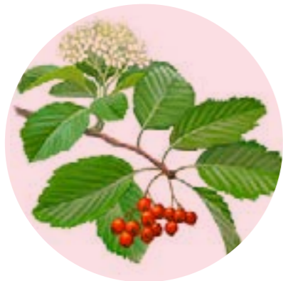
Nom comú: MOIXERA Nom científic: Sorbus spp. Estrat: arbre secundari