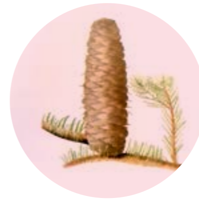
Nom comú: AVET Nom científic: Abies alba Estrat: arbre secundari