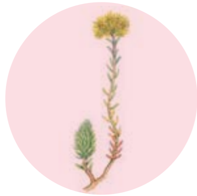
Nom comú: CRSPINELL Nom científic: Sedum reflexum Estrat: herba