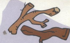
Branques mitjanes i grans